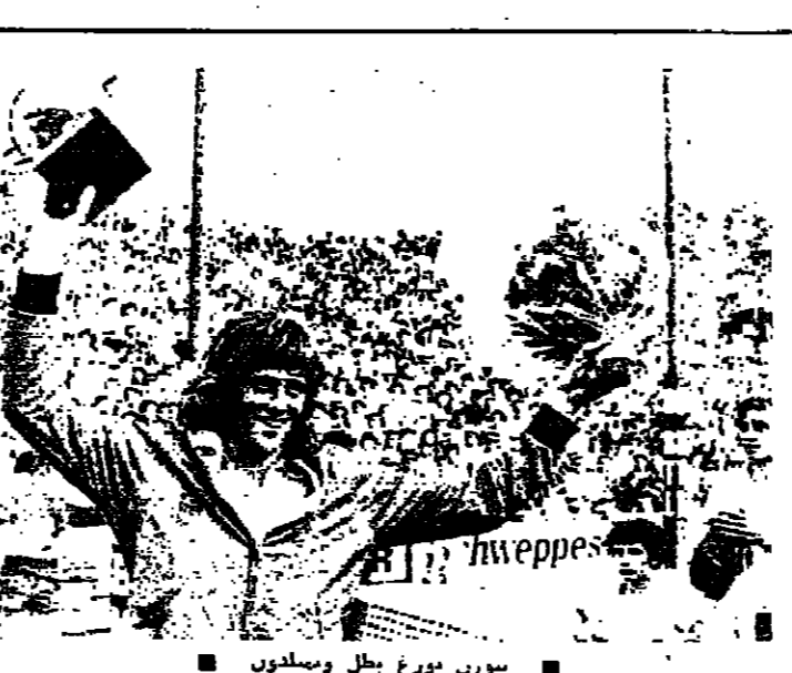
سورن بورغ يل ويمبلدون